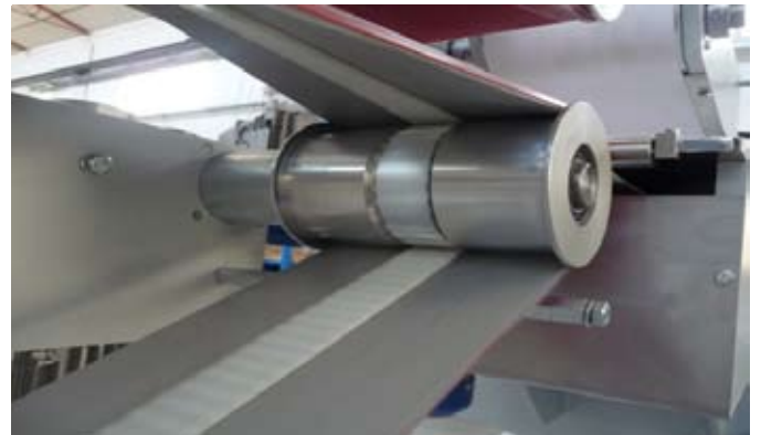
Immagine di un Twist a 180° con Guida SHARKDRIVE® in grado di adattarsi esattamente alle flessioni del nastro per il trasporto confezioni di carta. Regolazione in altezza da 10 a 100 mm.

Un dettaglio della unica puleggia dentata in moto durante il funzionamento del nastro Twist.